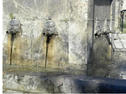
Detalle de la fuente

Levantada en 1837, es una bella construcción simétrica en piedra caliza labrada. El cuerpo central tiene seis caños y un pilón corrido que desagua en otros dos pilones laterales destinados al ganado. A ambos lados, cierran la construcción sendos arcos. Hasta la traída del agua a las casas (1961), fue, con la Fuente de los Caños, elemento vital del pueblo. Para llevar el agua se utilizaban habitualmente cántaros de barro