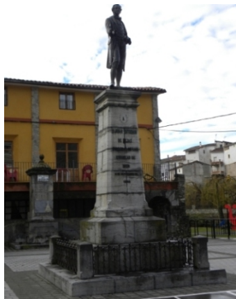
A D. Juan Esteban de Elías

"La estatua" es fruto de una doble suscripción popular que tuvo lugar entre 1917 y 1920. Los donativos fueron hechos por 489 personas, siendo la mayor aportación en metálico 322 pts, y las más pequeñas de 5 céntimos. 88 personas entregaron su donativo en pesos americanos. Según la Comisión Ejecutora, formada por siete personas, entre las dos suscripciones que se hicieron y los intereses abonados por la casa de Banca, se llegó a la suma de 13.726,87 Ptas.