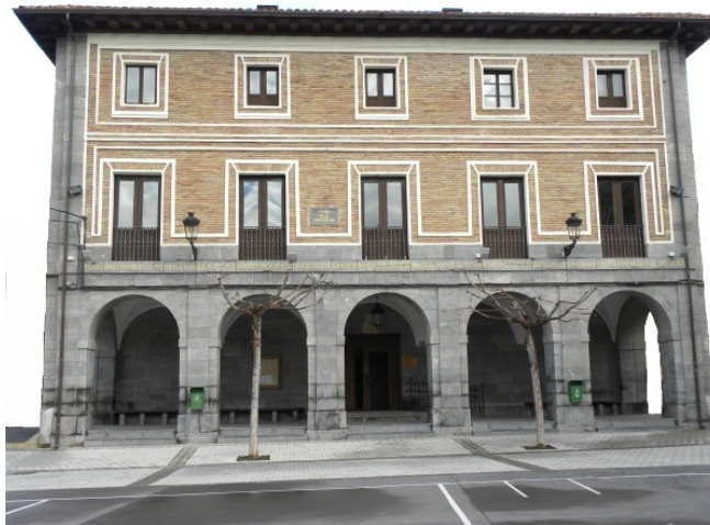
Ayuntamiento (antiguas escuelas de instrucción pública)

accedía al Ayuntamiento, que estaba en la planta baja. En el piso primero se encontraban las tres escuelas: párvulos (oeste), chicas (este) y chicos (sur). La última planta de este noble edificio está destinada a viviendas. Con la renovación realizada en 2010, la sede del consistorio está ahora en lo que fue escuela de chicos, y las otras dos se han reconvertido para otros usos.